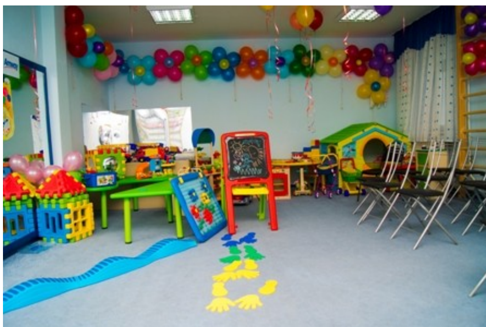
Методическое пособие для родителей